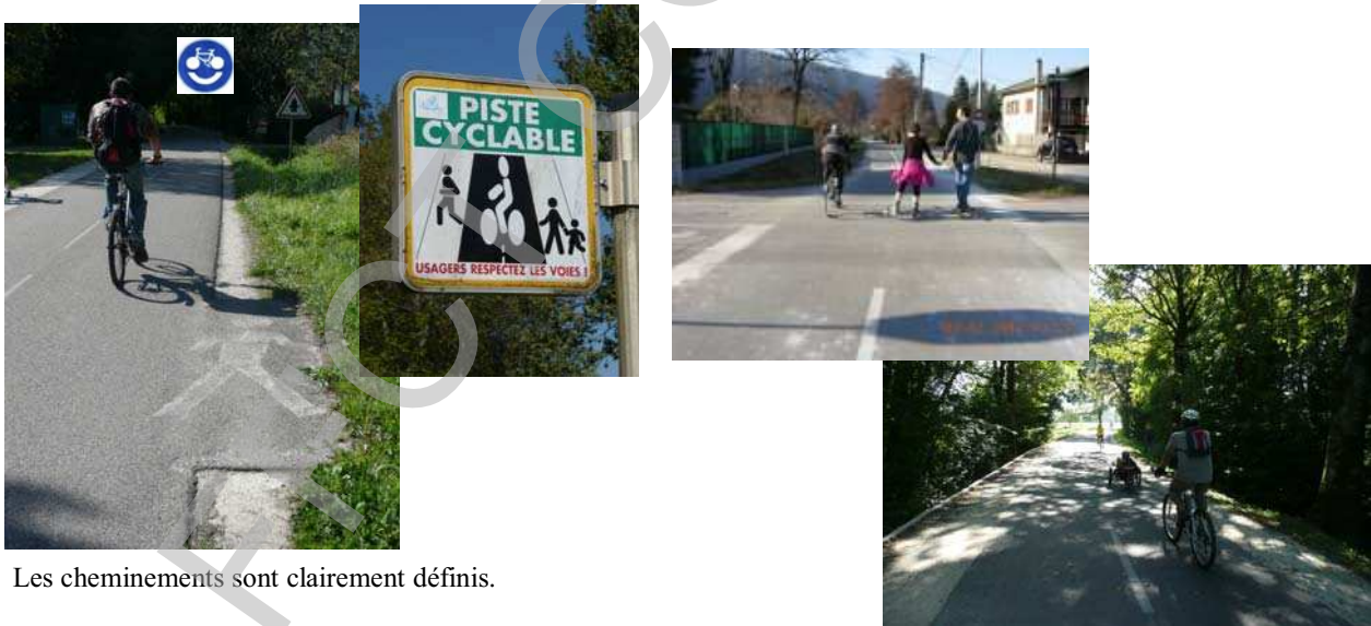
Les cheminements sont clairement définis.

Pour les voies vertes et les Véloroutes, ces itinéraires, d'une largeur de 3 mètres en général, doivent être élargis à l'approche des agglomérations où le trafic devient plus dense. Il convient alors de bien signaler par un marquage au sol, les cheminements des divers usagers (piétons-cyclistes) (voir photos)